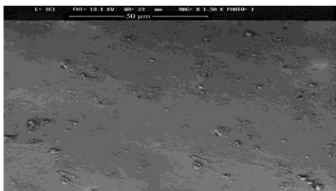
شکل ۲- تصویر میکروسکوپ الکترونی روشی در نمونه B

روی تأثیر جایگزینی ساکارز با شربت ذرت با فروکتوز بالا در کوکی اعلام نمودند با افزایش میزان شربت ذرت با فروکتوز بالا در فرمولاسیون، میزان شکاف‌های سطح محصول کاهش یافته و متعاقباً سطحی صاف ایجاد می‌شود. این محققین اعلام نمودند با افزایش میزان ساکارز، شکاف‌های سطحی افزایش می‌یابد (۹).