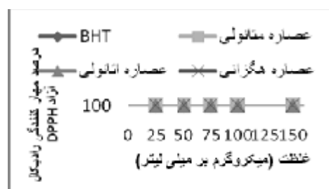
شکل 1- درصد مهار رادیکال های DPPH در غلظت های مختلف عصاره های برگ به در دمای استخراج 25°C و آنتی اکسیدان سنتزی BHT

برای تعیین قدرت مهار رادیکال های آزاد نتایج بر حسب درصد کاهش در میزان جذب محلول های DPPH در حضور عصاره نسبت به محلول DPPH فاقد عصاره بیان می گردد (9). مقایسه میانگین درصد مهار رادیکال های آزاد توسط غلظت های مختلف عصاره های الکلی (هگزانی، اتانولی و متانولی در دمای استخراج 25°C) برگ به و آنتی اکسیدان سنتزی BHT در شکل 1 نشان داده شده است. در محدوده غلظت 25-150 میکروگرم در میلی لیتر و دمای استخراج 25°C درجه سانتی گراد، درصد فعالیت مهارکنندگی آنتی اکسیدان سنتزی BHT، 91/9-% 51/56-%، عصاره هگزانی 35/44-% 3/94-%، عصاره اتانولی 80 %، 79/04-% 17/27% و عصاره متانولی 80 %، 87/55-% 38/57% تعیین شد. در تمامی غلظت های مورد بررسی فعالیت مهارکنندگی عصاره متانولی بالاتر از سایر عصاره های برگ به بود.